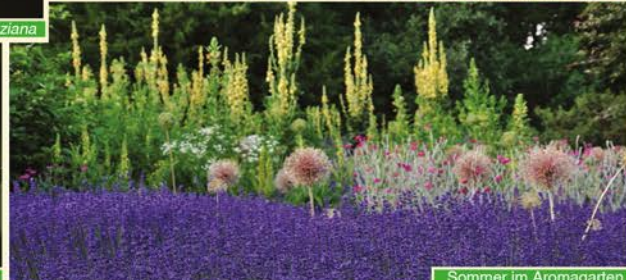
Sommer im Aromagarten