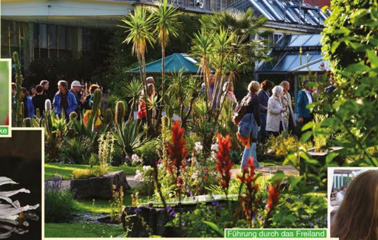
Führung durch das Freiland