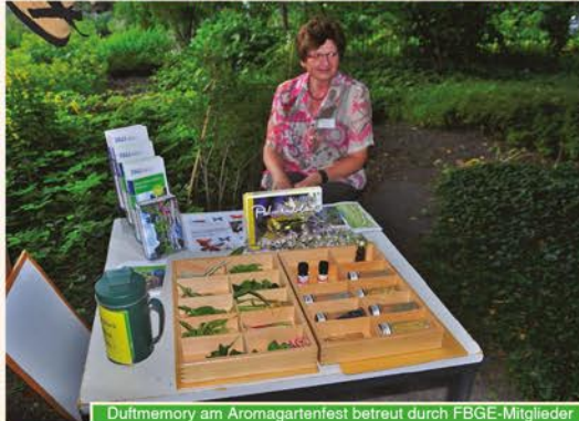
Duftmemory am Aromagartenfest betreut durch FBGE-Mitglieder