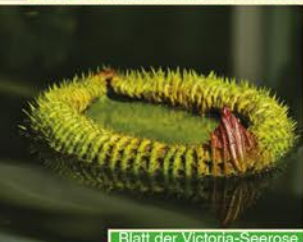
Blatt der Victoria-Seerose