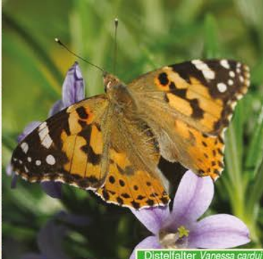
Distelfalter Vanessa cardui