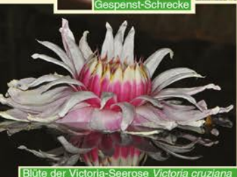
Blüte der Victoria-Seerose Victoria cruziana