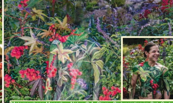
Metamorphose Mensch u. Natur © A. Stern - Bodypainting im Bot. Garten