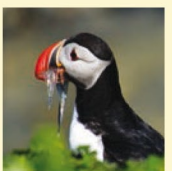
Reiseimpressionen Island: Papageitaucher