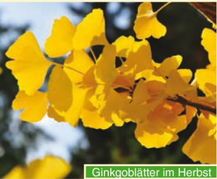
Ginkgoblätter im Herbst