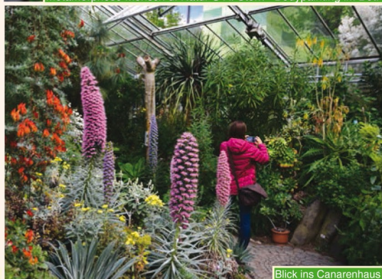
Blick ins Canarenhaus