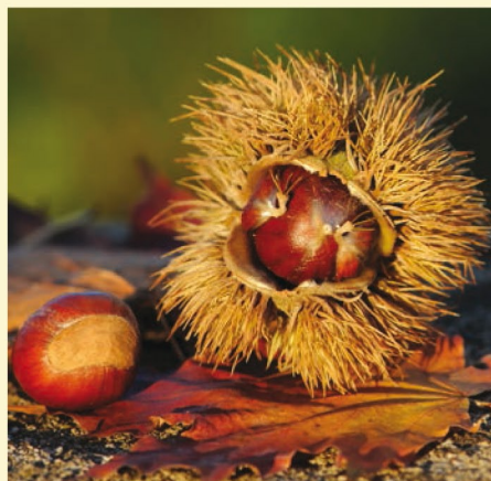
Ess-Kastanie

Wenn es draußen klirrend kalt wird und der Winter Einzug im Botanischen Garten der Friedrich-Alexander-Universität Erlangen-Nürnberg hält, dann ist die Jahreszeit der heißen Maroni gekommen. Die Geschichte vom Maronimann aus Ottfried Preußlers Buch ‘Die kleine Hexe’ gehört zu den Klassikern der Kinderbuchliteratur. In der eiskalten Jahreszeit macht sich die kleine Hexe auf den Weg zum Markt und trifft dort den Maronimann, der ihr eine Tüte mit dampfenden, leckeren Ess-Kastanien schenkt. Die Geschichte enthält viele kulturelle Hintergründe zu den Maronen. Besonders in der erntefreien, kalten Jahreszeit wurden die Kastanienfrüchte von Bauern als wichtige zusätzliche Einkommensquelle ge-