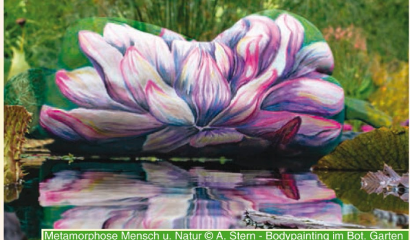
Metamorphose Mensch u. Natur © A. Stern - Bodypainting im Bot. Garten