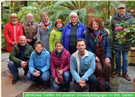
Jährliches Treffen mit unseren Umweltpädagogen im Bot. Garten