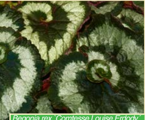
Begonia rex 'Comtesse Louise Erdody'