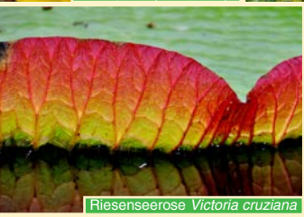
Riesenseerose Victoria cruziana