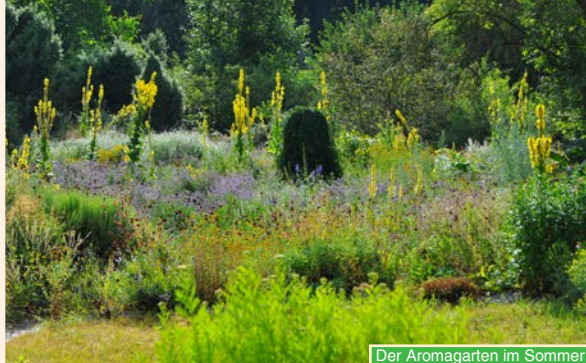
Der Aromagarten im Sommer