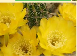
Echinopsis Hybr. 'Canary'