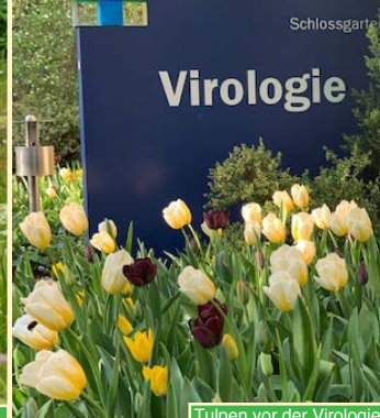
Tulpen vor der Virologie