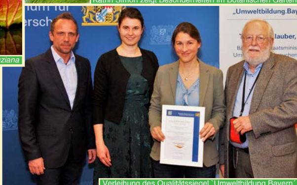
Verleihung des Qualitätssiegel 'Umweltbildung, Bayern'