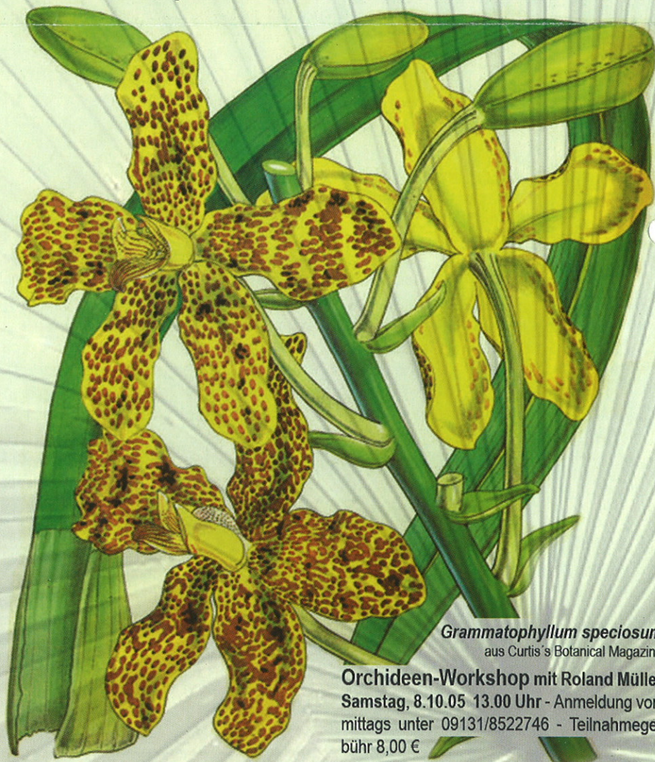
Grammatophyllum speciosum aus Curtis's Botanical Magazine

Auf die Frage nach seiner Lieblings-Orchidee kommt Roland Müller ins Grübeln. Schließlich, hartnäckiges Nachfragen ist nötig, nennt er die Vanille Vanilla planifolia , oder vielleicht doch das monströse Grammatophyllum speciosum , das vor der richtigen Blüte Scheinblüten entwickelt, – besonders mag er die Wildarten, aber eigentlich liebt er sie alle. Und wenn man seine leuchtenden Augen sieht, während er über sie spricht, versteht man auch, dass ihm heute schon bange vor dem Ruhestand ist. Die Orchideen werden ihm fehlen! c.w.