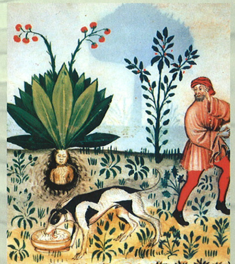
Mittelalterliche Darstellung der Alraunen'jagd'

Die nächste Führung „Professor Snape's Lieblingspflanzen ...“ findet am Mo 3.10.2005 um 14.00 statt. Treffpunkt Gewächshauseingang!