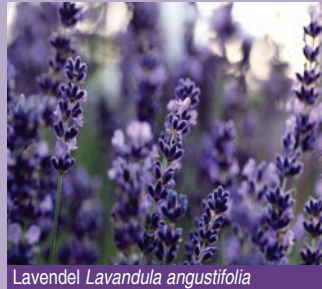
Lavendel Lavandula angustifolia

Immer der Nase nach Betritt man den Aromagarten, befindet man sich unversehens in einer Welt voller Wohlgeruch und optischer Reize. Während Farben und Formen in Bildern wiedergegeben werden können, sind Düfte als sinnliches Erlebnis etwas Vergängliches. Sie müssen immer wieder neu wahrgenommen werden und machen den besonderen Reiz des Gartens an der Palmsanlage aus. Neben dem charakteristischen Geruch wur-