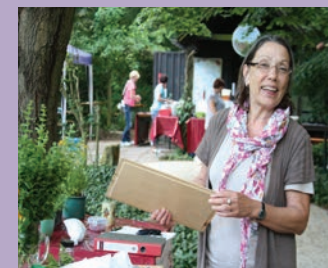
FBGE-Mitglieder helfen beim Aromagartenfest