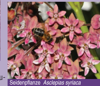
Seidenpflanze Asclepias syriaca

m 2 sind heute ca. 120 heimische und exotische Duft- und Aromapflanzen zu finden. Besucher des Aromagartens haben so die Möglichkeit, eine faszinierende Palette ausgesuchter Aromapflanzen kennenzulernen. Dabei erstaunt die Vielfalt der Duftnuancen, die jeder individuell für sich entdecken kann.