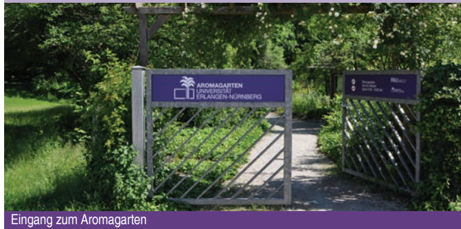
Eingang zum Aromagarten

Der Aromagarten in Erlangen liegt im Landschaftsschutzgebiet des Schwabachgrundes östlich der Erlanger Innenstadt, nur 15 Gehminuten vom Botanischen Garten entfernt. Seit seiner Entstehung 1981 hat sich sein Erscheinungsbild immer wieder verändert. In den letzten Jahre konnten so sorgfältig ausgewählte Duftpflanzen ergänzt, neue Pflegekonzepte entwickelt und das Angebot der Führungen weiter ausgebaut werden.