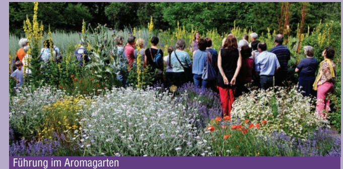
Führung im Aromagarten

Führungen Von April bis Oktober finden öffentliche thematische Gartenführungen statt, bei denen einzelne Pflanzen, aber auch die Inhaltsstoffe und ihre (Heil-)Wirkung vorgestellt werden. Auf Wunsch können individuelle Führungen für Gruppen und Schulklassen unter www.botanischer-garten.fau.de/fuehrungen gebucht werden.