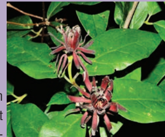
Gewürzstrauch Calycanthus floridus

de bei der Auswahl der Pflanzen Wert darauf gelegt, möglichst interessante, ausdauernde Arten auszuwählen, die einen hohen Gehalt verschiedener Wirkstoffe haben. Aus diesem Grund bietet sich dem Besucher ein Geruchserlebnis der ganz besonderen Art: Durch die großflächige Pflanzung vieler Exemplare einer Pflanzenart wird der Duft der einzelnen Pflanzen verstärkt und kann so noch intensiver wahrgenommen werden.