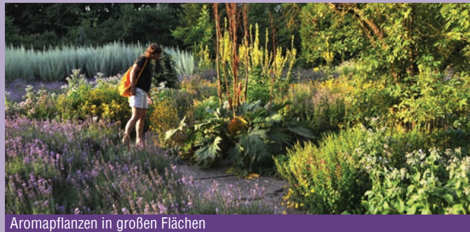
Aromapflanzen in großen Flächen

de bei der Auswahl der Pflanzen Wert darauf gelegt, möglichst interessante, ausdauernde Arten auszuwählen, die einen hohen Gehalt verschiedener Wirkstoffe haben. Aus diesem Grund bietet sich dem Besucher ein Geruchserlebnis der ganz besonderen Art: Durch die großflächige Pflanzung vieler Exemplare einer Pflanzenart wird der Duft der einzelnen Pflanzen verstärkt und kann so noch intensiver wahrgenommen werden.