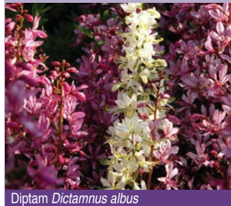
Diptam Dictamnus albus

Er gehört zur Friedrich-Alexander-Universität und wird vom Botanischen Garten betreut und gepflegt. Alle Pflanzen müssen mit den oft extremen, meist sehr trockenen Bedingungen im Garten auskommen. Auf chemischen Pflanzenschutz und eine dauerhafte Bewässerung wird verzichtet. Auf einer Fläche von rund 9.000